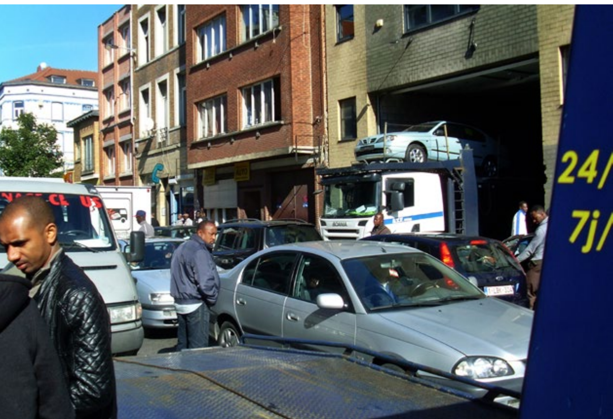
Er heerst steeds een grote drukte rond Belgo Malienne in de Liverpoolstraat, trefpunt van vooral Guineeërs

De aankoop, verkoop en het klaarmaken van de auto's voor de export gebeurt voor het merendeel in de Heyvaertbuurt. De buurt is dan ook internationaal gekend door zowel de toevoerders van tweedehands- en afgedankte auto's als door het cliënteel van de vragende landen. Japanse automerken, Toyota op kop, zijn het meest gegeerd. In Afrika rijden behoorlijk wat Japanse auto's zodat wisselstukken dan ruim voorradig zijn.