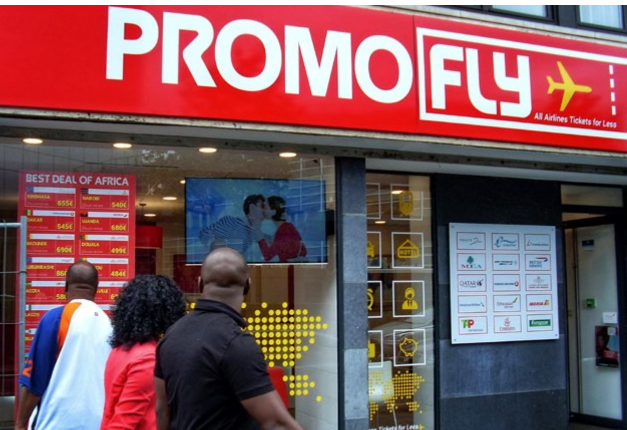
Kuregem, een geglobaliseerde wijk, is op verschillende manieren verbonden met de wereld