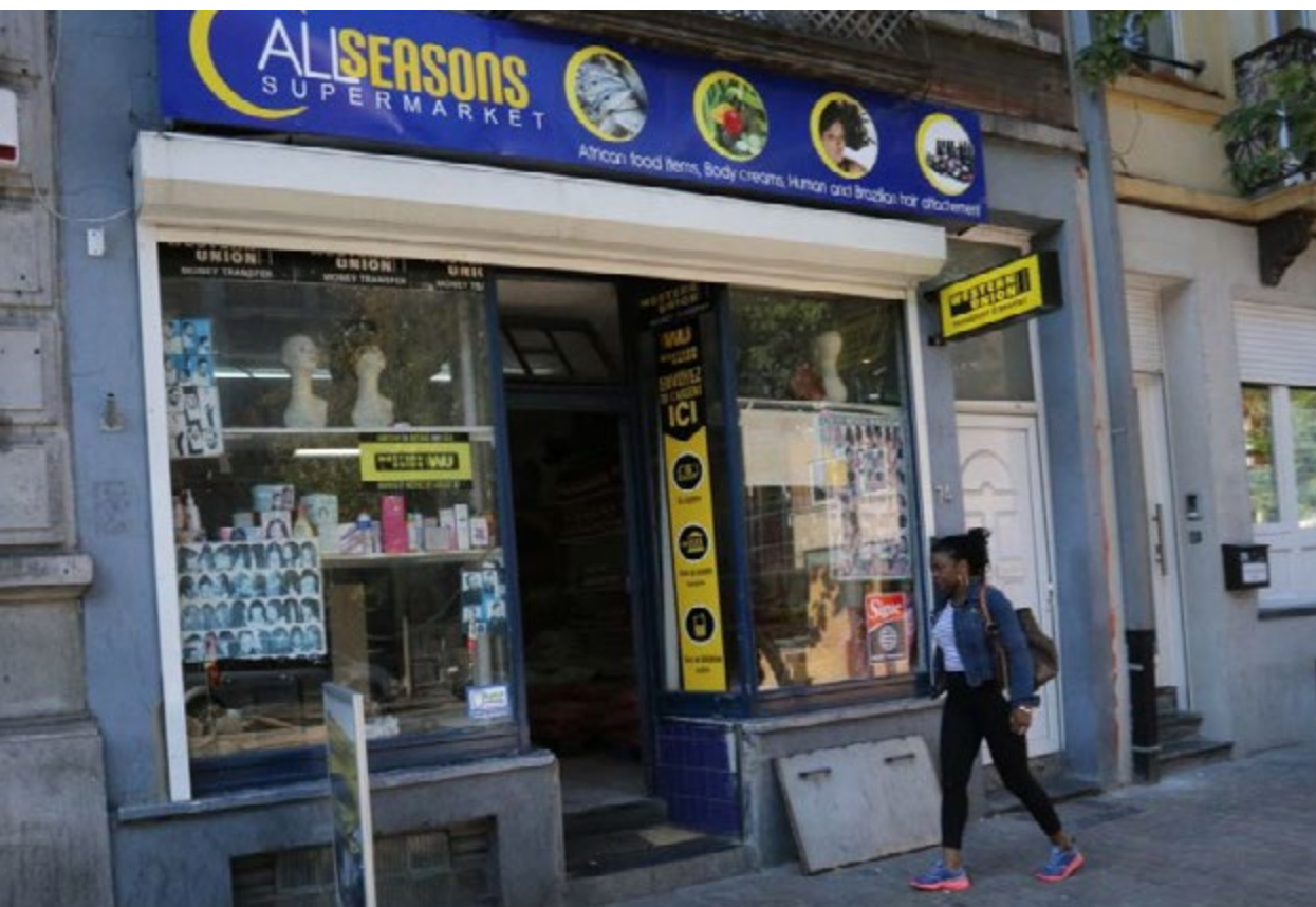
Deze winkel is in de Clemenceaulaan een trefpunt voor Nigerianen

Het koloniaal verleden van België in Congo en de band met Burundi en Rwanda heeft wel een zekere invloed gehad op de migratie vanuit Centraal-Afrika naar België. In Kuregem is er onder de Zwart-Afrikanen een belangrijke Congoleser en in mindere mate een Rwandese en Burundese aanwezigheid. Als we ervan uitgaan dat de aantallen Zwart-Afrikanen met de Belgische nationaliteit en Zwart-Afrikanen zonder wettig verblijf min of meer dezelfde trend volgen als het aantal Zwart-Afrikanen met een vreemde nationaliteit zoals vermeld in de registers van de gemeente Anderlecht, dan zijn de meest voorkomende Zwart-Afrikanen in Kuregem afkomstig uit Guinee, Congo, Kameroen, Niger, Nigeria, Mauritanië, Togo, Rwanda, Senegal, Angola, Ivoorkust, Sierra Leone, Benin, Somalië, Ghana en Burundi.