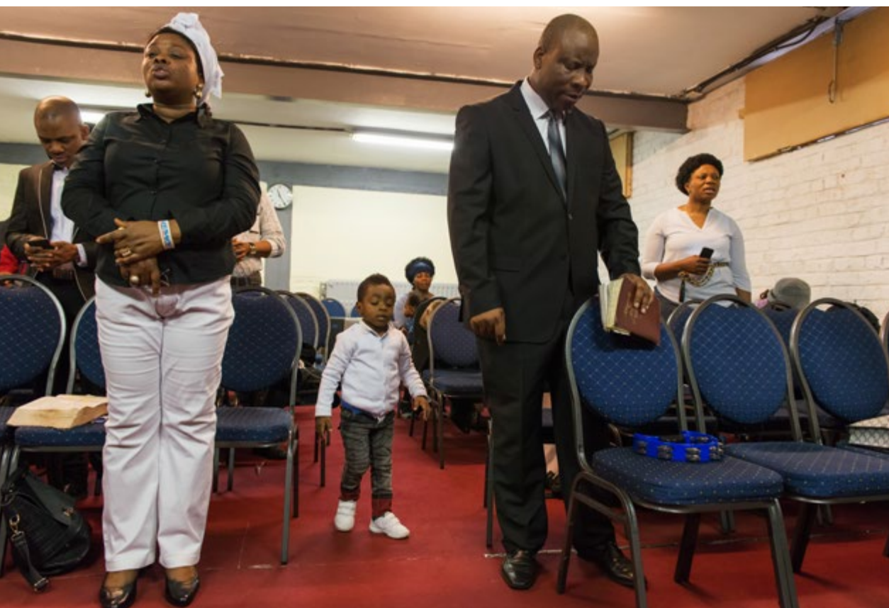
The Redeemed Christian Church of God in de Onderwijsstraat

Sommige kerken mogen zich dan nog 'églises du réveil' noemen, toch zijn er ook 'églises du sommeil', die hun ogen sluiten voor en de aandacht afleiden van de reële sociale problematiek waarin mensen kunnen zitten. Je kan echter niet ontkennen dat de troostfunctie één van de belangrijke taken van elke godsdienst is. Als het zich daartoe zou beperken, dan zou de kritiek van Marx "godsdienst als opium van het volk" terecht zijn. Een aantal van deze pinksterkerken proberen echter ook aan de reële materiële en sociale noden tegemoet te komen.