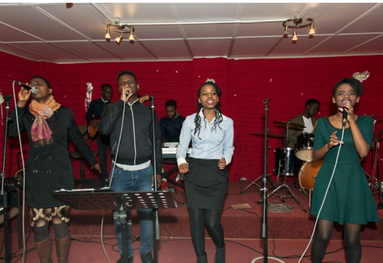
In de kerk Mission Internationale du Plein Evangile (MIPE) in de Onderwijsstraat wordt uitbundig gezongen in het Kinyarwanda en het Frans

S uperdiversiteit vertaalt zich ook in de verschillende religies die mensen aanhangen en in een sterke toename van de diversiteit bij de erkende erediensten. Religiositeit neemt niet af in ons land, integendeel. In Kuregem is een belangrijk deel van de Zwart-Afrikanen moslim en een ander belangrijk deel christen. Zwart-Afrikaanse moslims treffen we aan in een van de moskeeën van de wijk. Vooral de moskee Al Fath in de Scheikundigestraat en een kleinere moskee in de Heyvaertstraat tellen bij hun gelovigen heel wat West-Afrikanen. Het zijn vooral Guineeërs en Nigerezen – beiden sterk aanwezig in de autohandel in dit deel van Kuregem – maar ook mensen afkomstig uit Senegal, Mauritanië, Mali, Gambia, Nigeria, Sierra Leone en Somalië, allemaal Afrikaanse landen met een overwegende of belangrijke moslimbevolking.