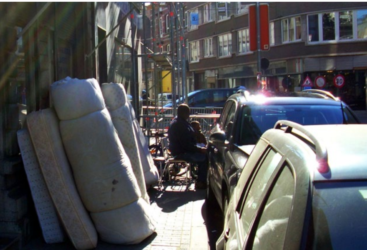
In een kleine opslagruimte in de Schipstraat liggen matrassen tot tegen het plafond