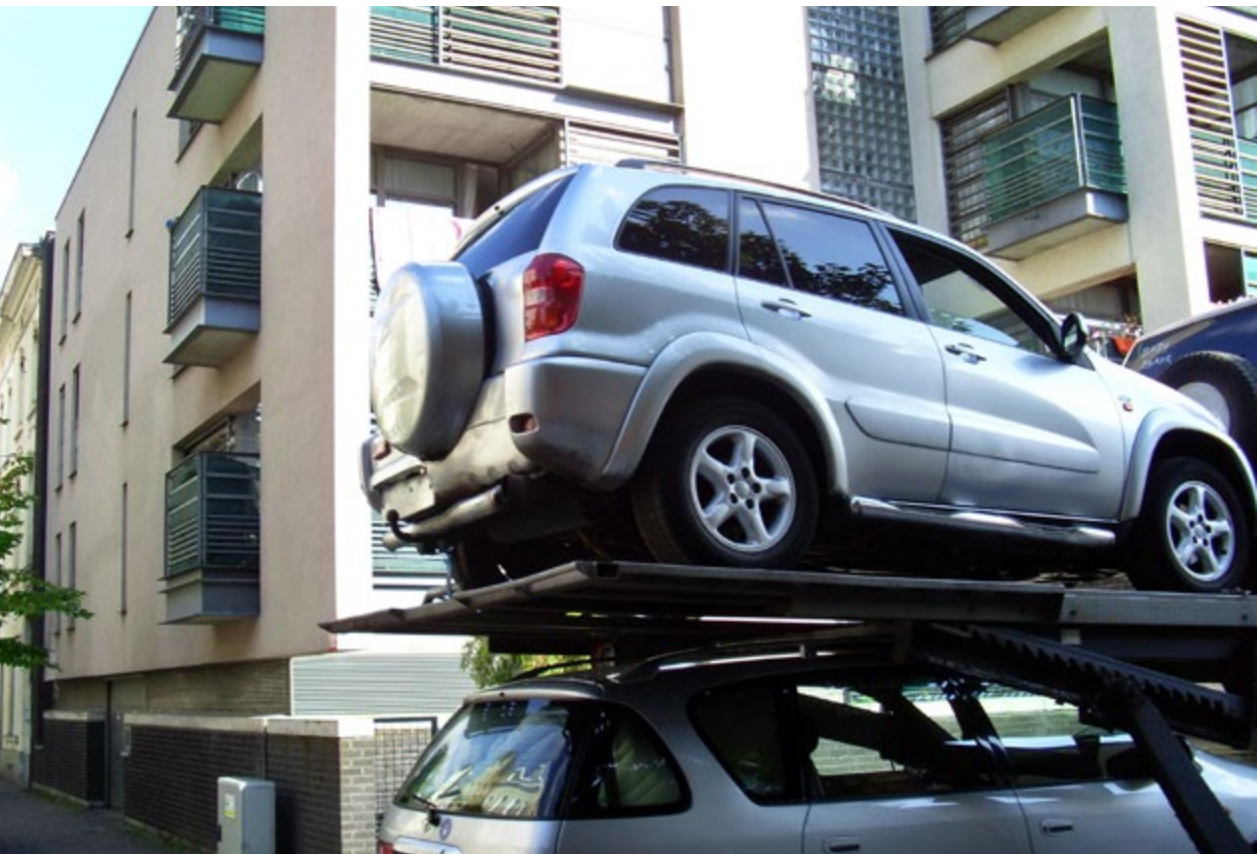
Dagelijks doorkruisen opliggers de Dauwwijk