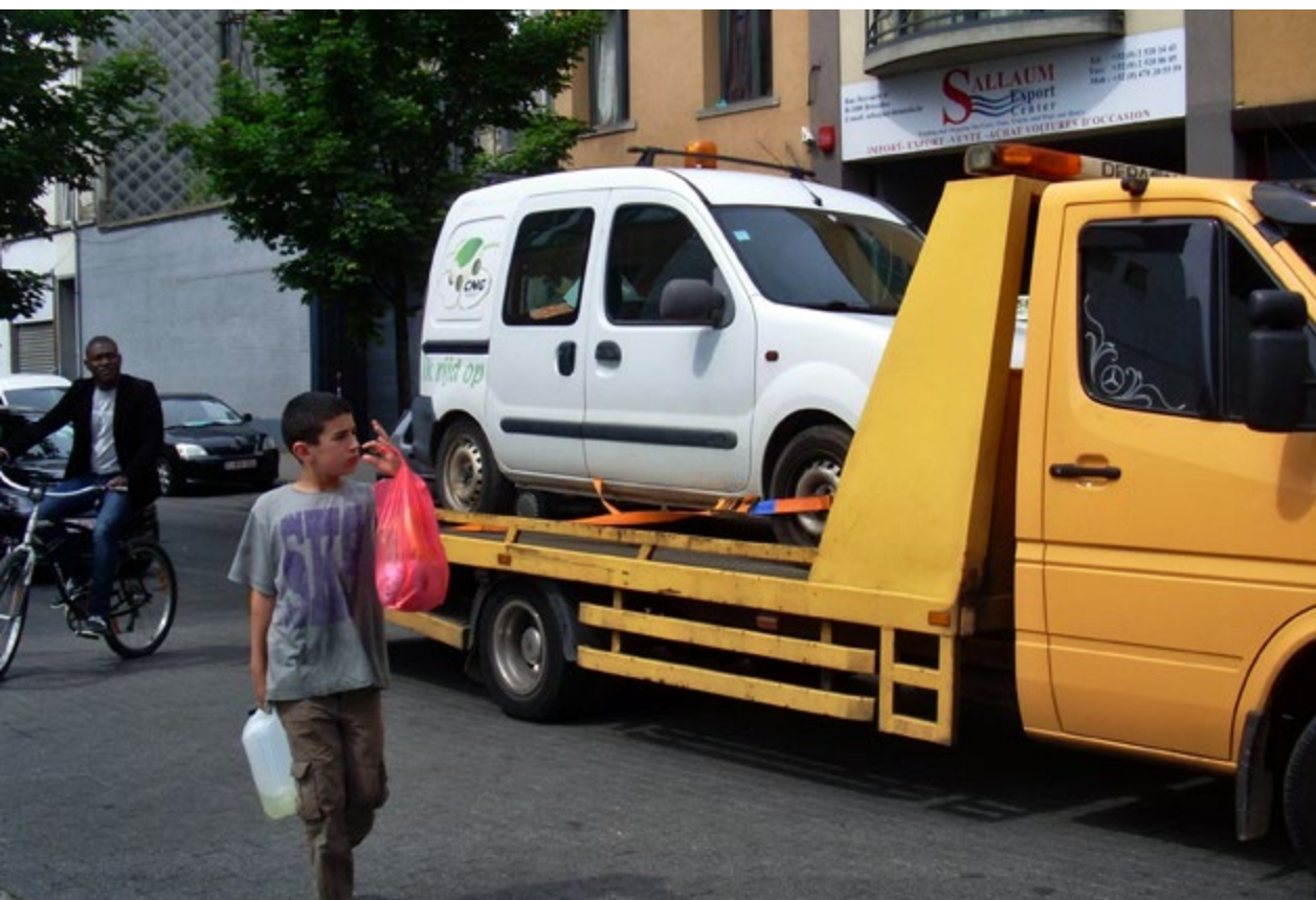
De Heyvaertstraat ter hoogte van Facar en Sallaum

Voor de gemeente Sint-Jans-Molenbeek wil snel werk maken van een heropleving en van de Heyvaertbuurt een aangename woonwijk maken. Daarom worden – als politiek statement – nieuwe vergunningen systematisch geweigerd. Door de bouw van nieuwe woningen en een school en door de aanleg van een stadstuin en een autovrije kanaalkade hopen de gemeenten de autohandel te stoppen. Er zijn plannen om de autohandel te verplaatsen naar een terrein aan het kanaal vlakbij het waterzuiveringsstation van Brussel-Noord. In de Brusselse Voorhaven zou een nieuwe roll-on-roll-offterminal komen bestemd voor het transport van voertuigen via binnenscheepvaart, het overladen en het ontwikkelen van ruimten voor de handel en bijhorende activiteiten. Een beslissing hierover is bij de Brusselse regering nog niet genomen.