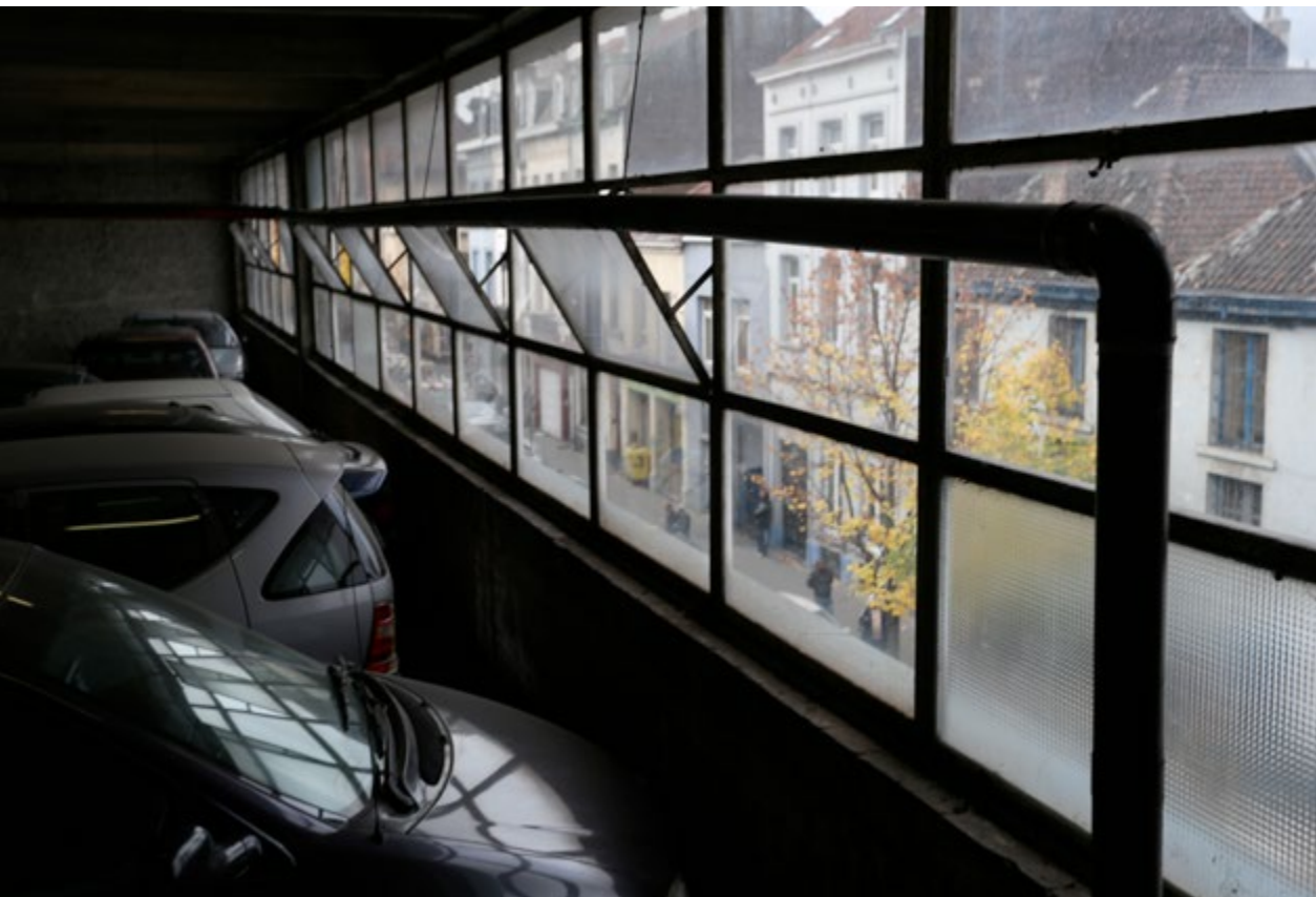
De Heyvaertstraat speelt met de gemeentegrens: doorheen de ramen van een opslagruimte van Socar – gemeente Anderlecht – een blik op de overkant van de straat, grondgebied Sint-Jans-Molenbeek