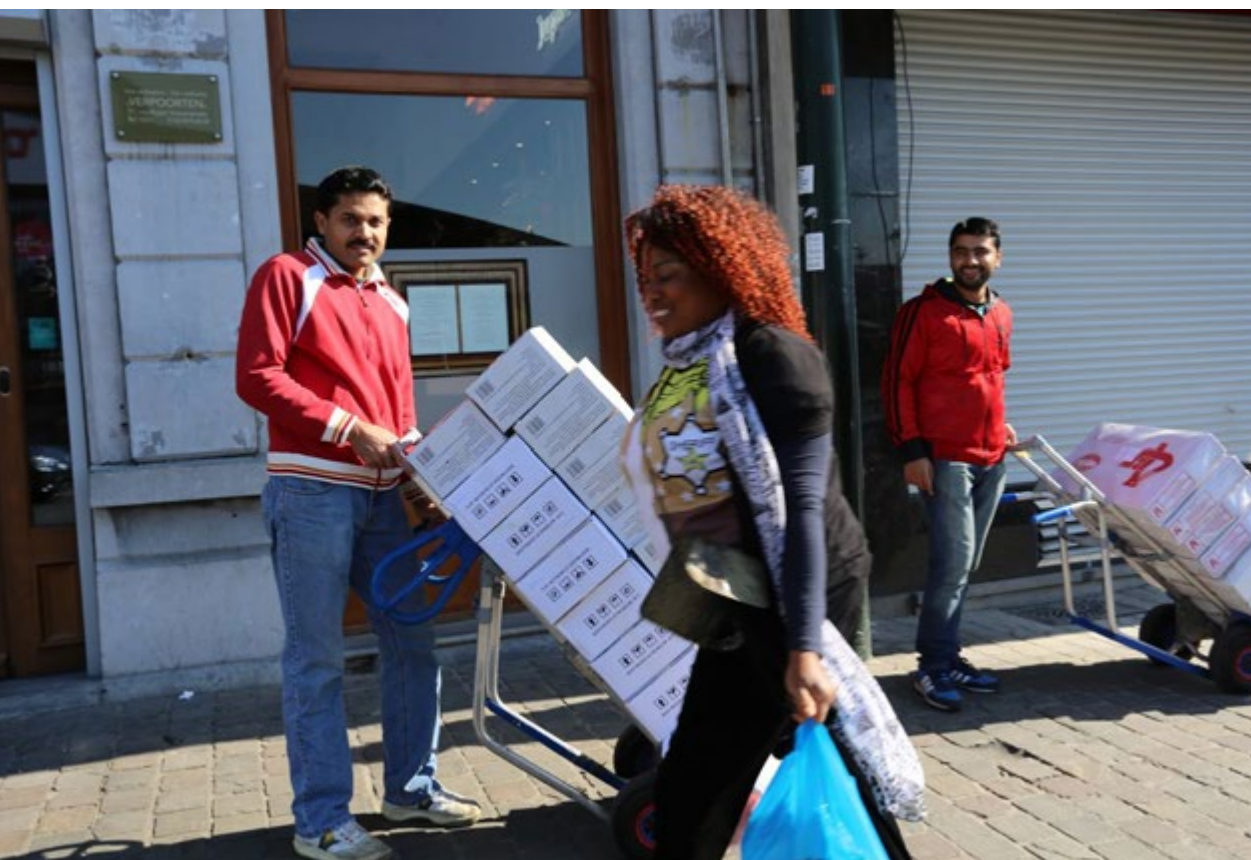
Sommige winkels in de Ropsy-Chaudronstraat worden bevoorrad door de groothandelszaken in voeding gelegen in de nabije Schipstraat en Passerstraat

De aanwezigheid van de markt aan het Anderlechtse slachthuis en de autohandel in de Heyvaertbuurt – voor een belangrijk deel gericht op Zwart-Afrika – deed in Kuregem een "Nieuw Matonge" ontstaan. Zoals in Kinshasa is Nieuw Matonge ook hier een belangrijk handelscentrum met een levendige markt. In Brussel is Nieuw Matonge, net zoals Matonge, geen Afrikaanse wijk. Dat is enkel in de perceptie van de Belgen zo. Beide wijken zijn superdivers.