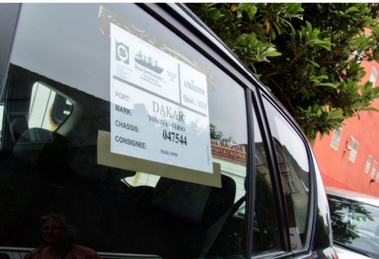
Een Toyota exportklaar gemaakt door Socar Shipping Agency met bestemming Dakar

Een ander element in het ontstaan van de bloeiende autohandel vormde de automarkt op de terreinen van het slachthuis. Van 1979 tot 1993 werden er elke zondag tweedehandsauto's verkocht. Door het enorme succes ontstond er naast de officiële automarkt een parallel circuit. Autohandelaren huurden oude leegstaande ateliers en stapelhuizen om er een eigen handel in tweedehandswagens op te zetten. Dat er zo geen standgeld op de markt moest betaald worden en dat de verkoop bovendien de hele week kon gebeuren, waren belangrijke voordelen. Gemeentelijke maatregelen zorgden er uiteindelijk voor dat in 1993 de automarkt op de terreinen van het slachthuis verdween en zich verplaatste naar het nabij gelegen Lot in de gemeente Beersel, maar de autohandel in de Heyvaertbuurt bleef en breidde zich zelfs uit.