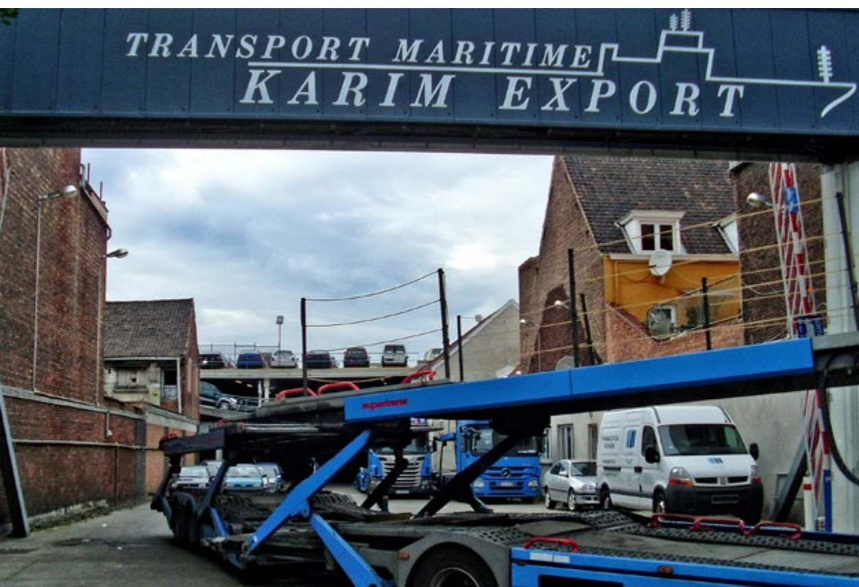
Karim – met momenteel vier generaties in België – startte zijn bedrijf in 1979 en is sinds 1989 gevestigd in de Heyvaertstraat