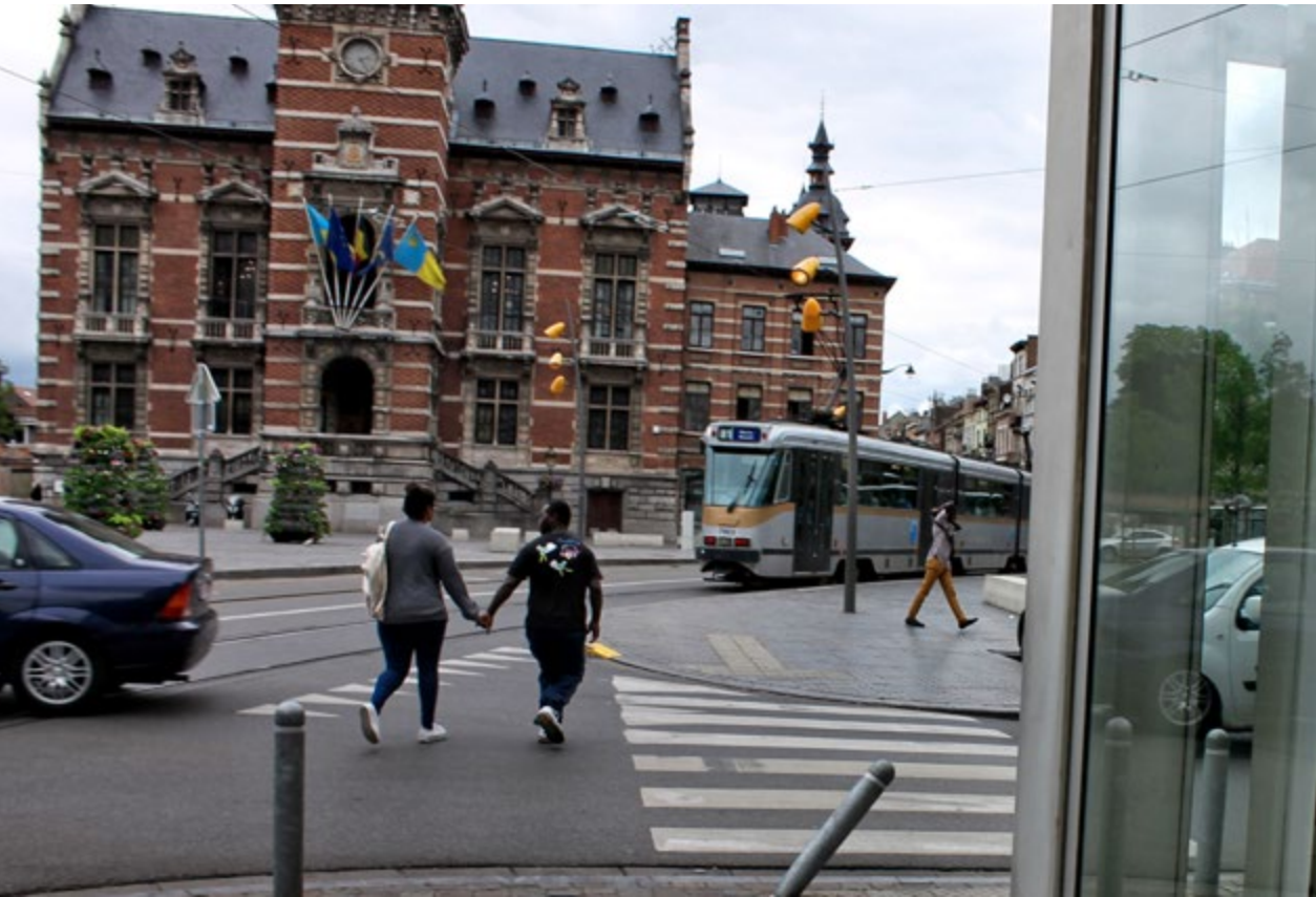
Het Raadsplein met het Anderlechtse gemeentehuis