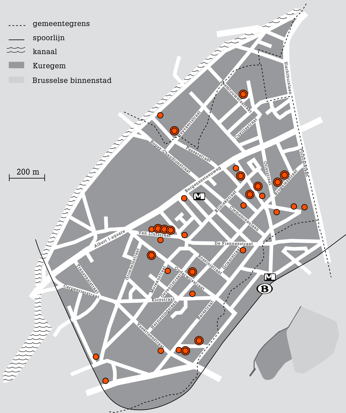
Spreiding van evangelische kerken (januari 2016, niet volledig)