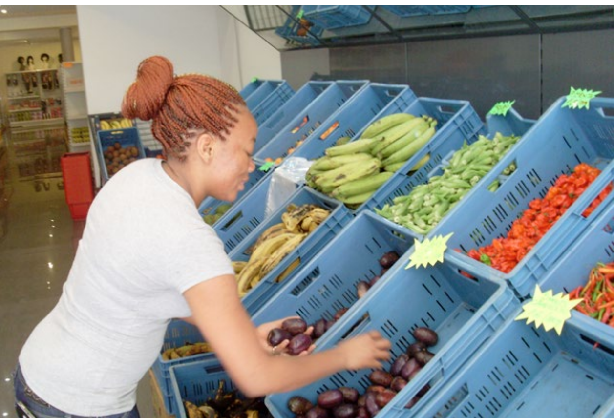
Safou – één van de weinige van oorsprong Afrikaanse vruchten – te midden van een ruim aanbod versvoeding in Afrika Market