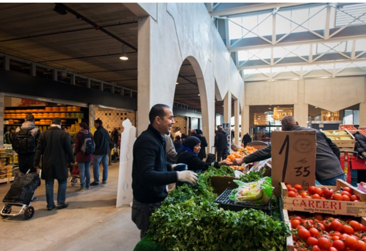
Een Zuiderse sfeer in de Foodmet