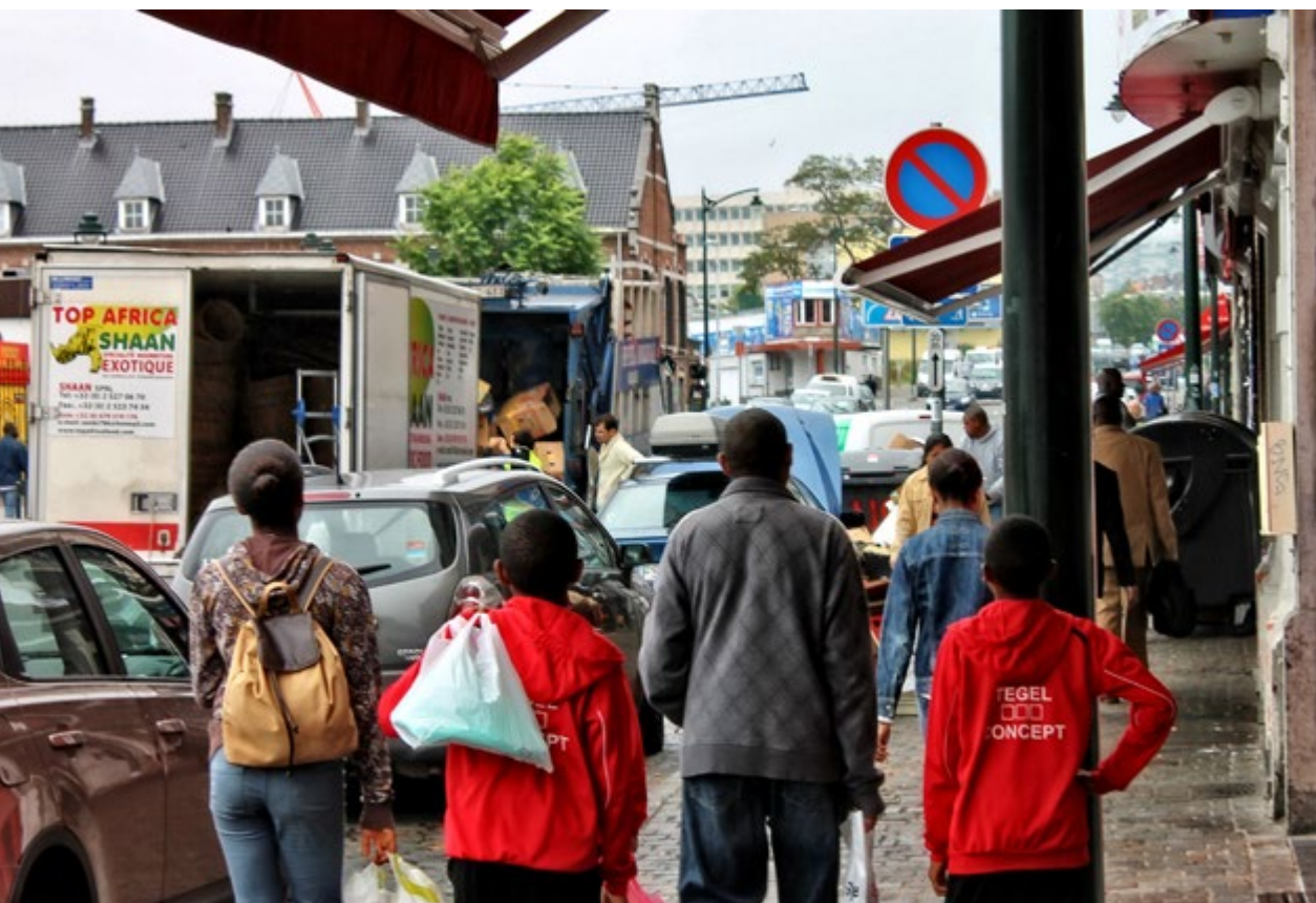
Drukke in de Ropsy-Chaudronstraat: een Afrikaans gezin geladen met hun aankopen en de groothandel Top Africa Shaan die een winkel bevoorraadt

Een andere actieve stof is het hormoon clobetasol, een geneesmiddel om jeuk en huidontsteking te behandelen en dat onder de vorm van crèmes te koop is bij de apotheker. Deze minder krachtige crèmes worden ook gebruikt om de huid te bleken. Ook clobetasol heeft bijwerkingen. Het veroorzaakt zwarte vlekken en het maakt de huid dun waardoor ze haar natuurlijke bescherming verliest. Dit kan leiden tot een verhoogde bloeddruk en diabetes.