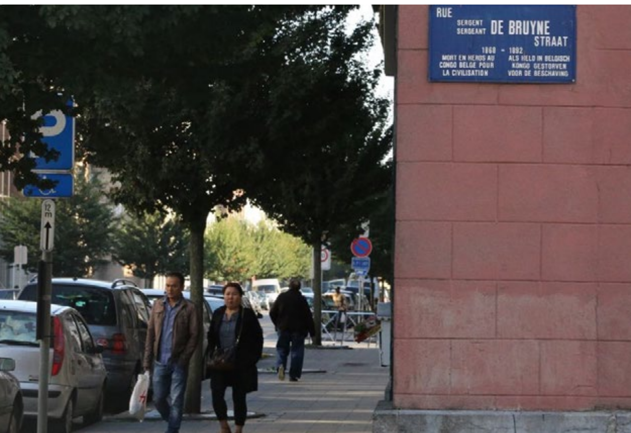
Een verwijzing in Kuregem naar het Belgisch koloniaal verleden