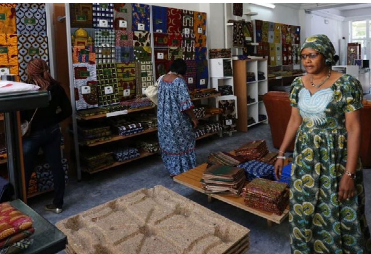
Ruime keuze van wax in de winkel Diosa – uitgebaat door een Malinees – in de Clemenceaulaan