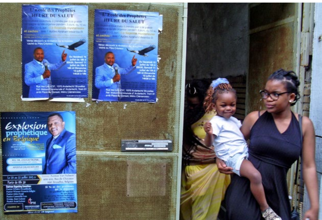
Poort die toegang biedt tot zes pinksterkerken die onderdak vonden in enkele oude industriële panden in de Van Lintstraat