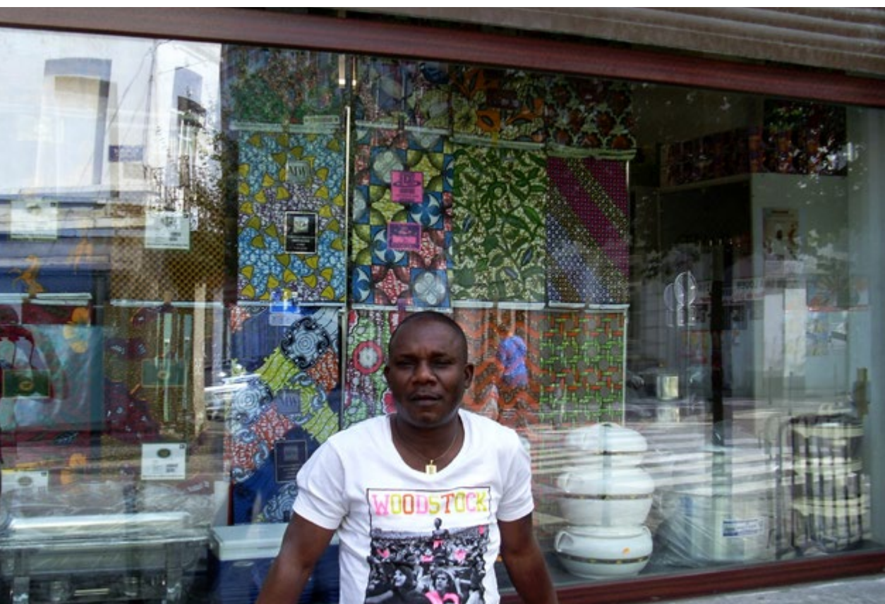
De Ghanese Angolees Dos Santos die met zijn winkel startte in de Kliniekstraat vind je nu, samen met Zion Beauty, in de Brogniezstraat