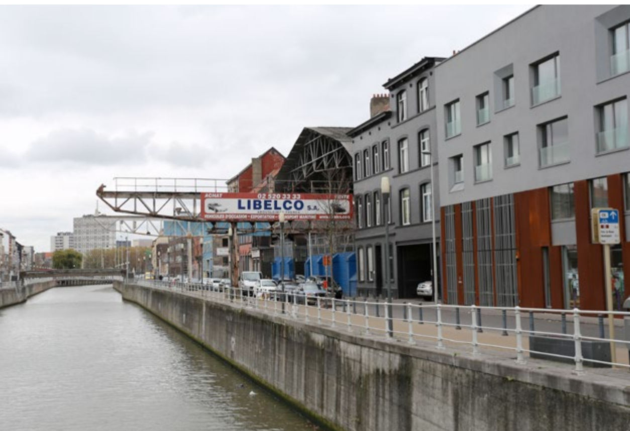
Als Libelco, gelegen aan de Nijverheidskaai, de boeken zou neerleggen, zou de gemeente Sint-Jans-Molenbeek graag het terrein met de gebouwen kopen