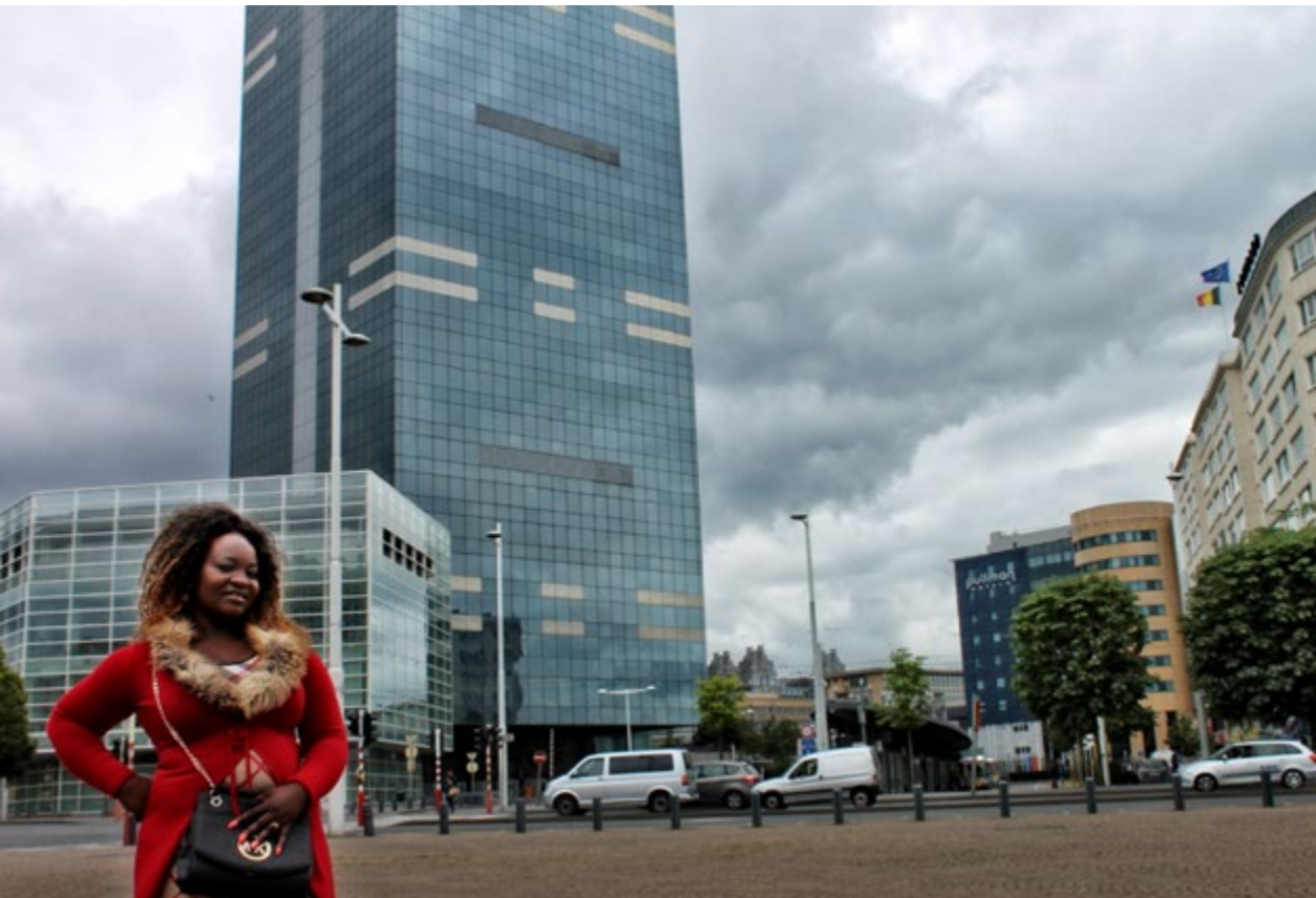
Een Afrikaanse dame op het Baraplein