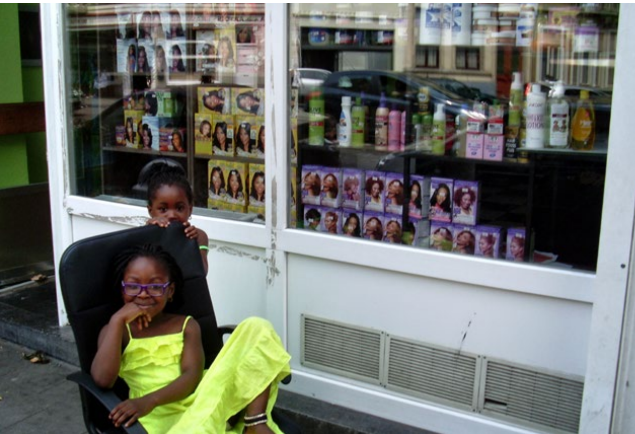
Een Afrikaans kapsalon – hier in de De Fiennesstraat – is meestal ook een ontmoetingsplaats