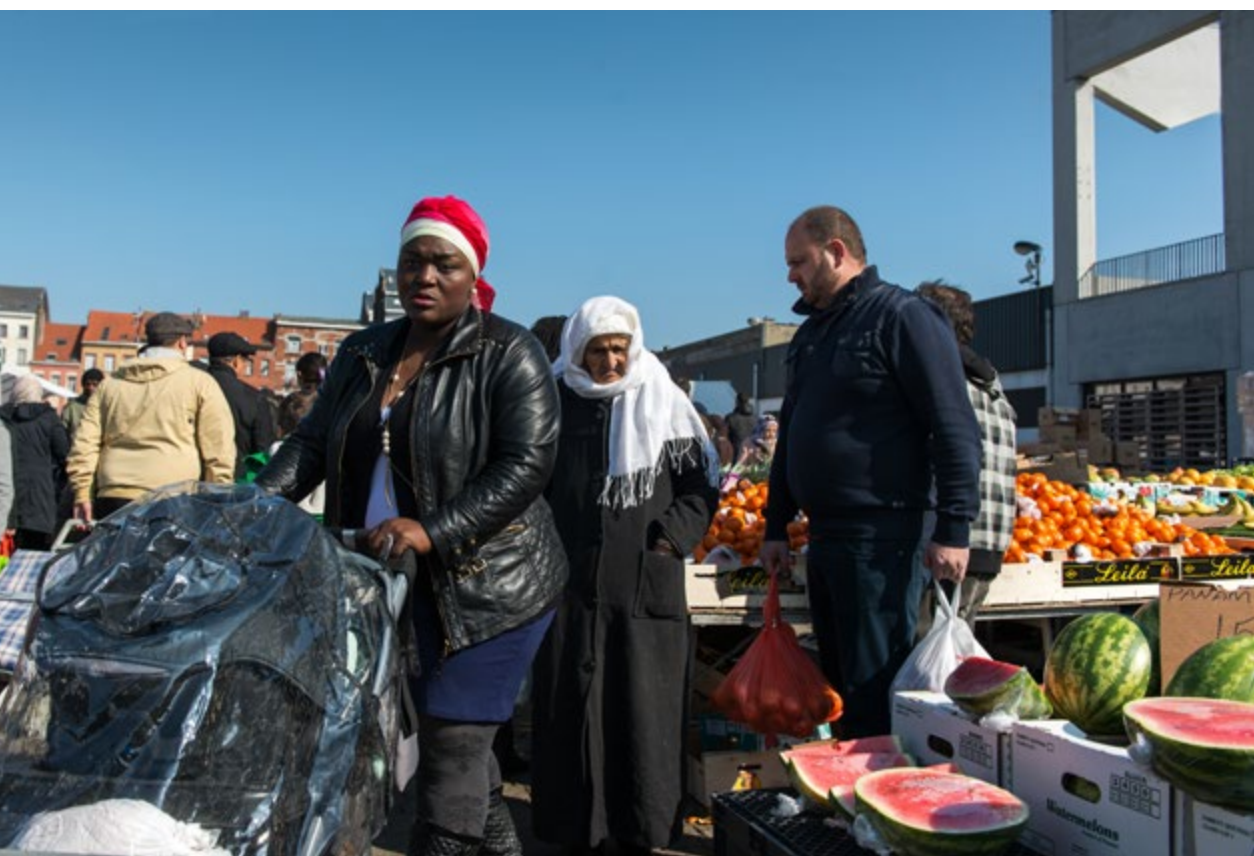
De consumentenmarkt van Abattoir op een zondag