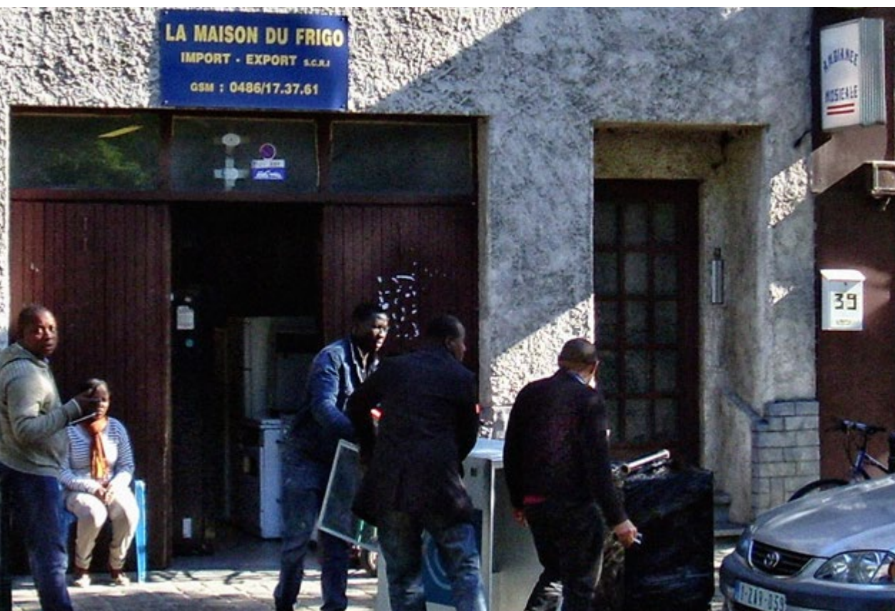
Een meer passende naam kon deze opslagruimte in de Zeemtouwersstraat niet bedenken