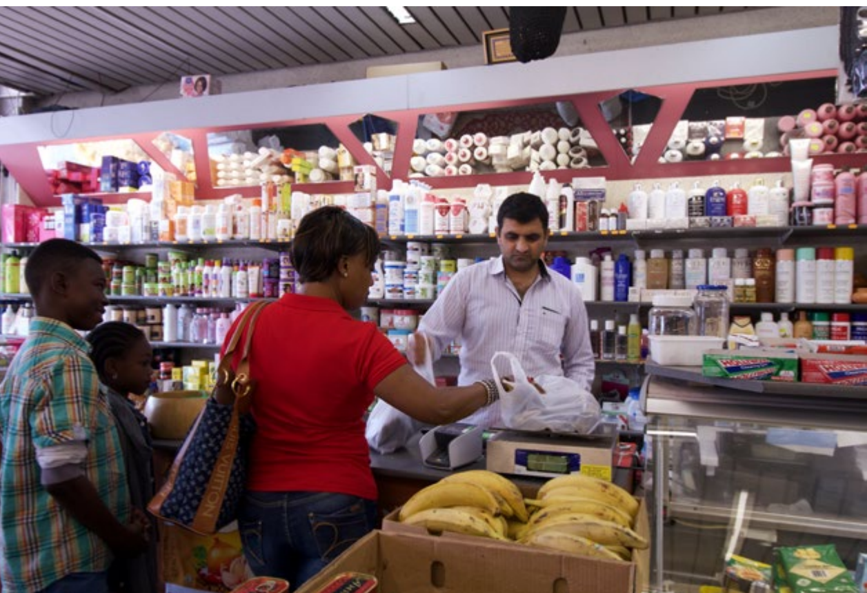
Winkel in de Ropsy-Chaudronstraat

In Afrika wordt hibiscus verwerkt in sausen – zoals in het Senegalese nationaal gerecht thiéboudienne – of gedroogd gebruikt om er zowel warme als koude dranken van te maken. In het Wolof, één van de talen die in Senegal worden gesproken, is de naam voor hibiscus bissap. Ook tamarinde – in het Wolof dakhar – is een van de ingrediënten van thiéboudienne.