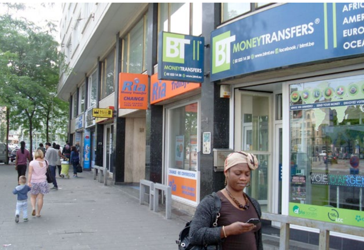
Op de foto drie van de vijf geldtransferkantoren die je aantreft op het Baraplein